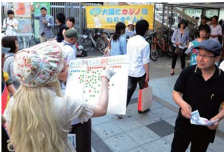
シール投票を反対が多数(大阪駅で)

カジノは、ルーレットやバカラ、スロットマシンなどの遊技・ゲームを無制限の賭博にしたものです。賭博そのものの開帳行為であり、刑法185、186条に反する犯罪です。大阪府や大阪府など、自治体の本来の仕事は「住民の福祉の向上」です。住民の未来をカジノにかける「ばくち」はやめるべきではないでしょうか？